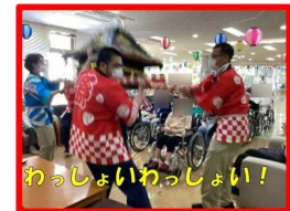
わっしょいわっしょい!

今年のおやつメニューは定番のたこやきと焼きとうもろこし、すいか、綿菓子。ノンアルコールビールの提供もあり久しぶりに呑兵衛気分を味わえたことでしょう。