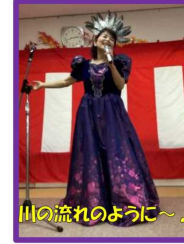
川の流れるように〜♪